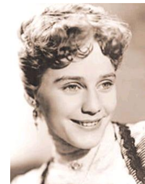
Maria Schell, como Grushenka, en Los Hermanos Karamazov (1958), de Richard Brooks